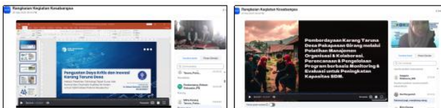
Gambar 2. FGD Sosialisasi dan Koordinasi Awal

Kegiatan diawali dengan Focus Group Discussion (FGD) (Gambar 2) yang dihadiri oleh perangkat desa, pengurus Karang Taruna “Putra Binangkit”, dan pengelola BUMDes “Pasir Gubah”, serta tim pelaksana. FGD berhasil merumuskan komitmen bersama dan menghasilkan dokumen kunci: Nota Kesepahaman berupa Surat Keputusan (SK) Nomor: 145/HMS/VIII/2025 yang mengesahkan skema kolaborasi antara Karang Taruna dan BUMDes dalam pengelolaan teknologi. SK ini secara resmi menetapkan Karang Taruna sebagai penanggung jawab operasional dan perawatan alat, sementara BUMDes bertanggung jawab pada aspek produksi dan pemasaran. Hasil ini menunjukkan tingginya tingkat ownership dan komitmen pemerintah desa terhadap program, yang merupakan fondasi penting untuk keberlanjutan.