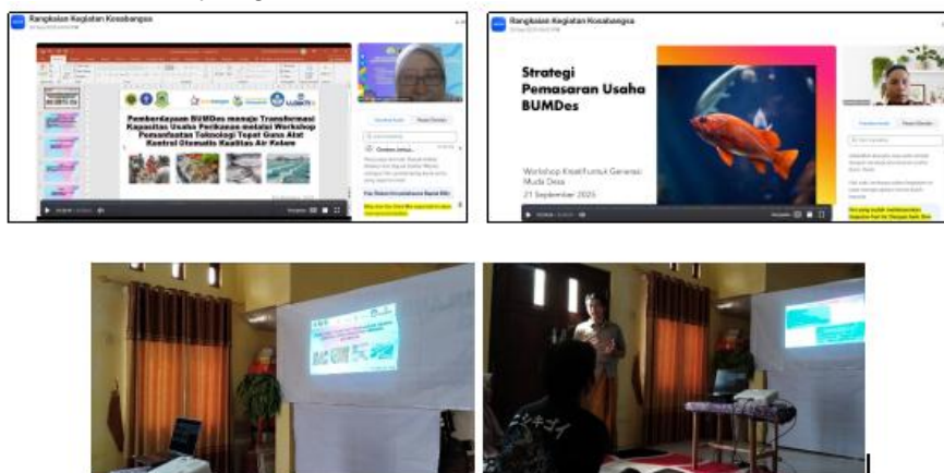
Gambar 4. Proses pelatihan strategi pemasaran usaha perikanan BUMDes

Pada pelatihan BUMDes aktif berpartisipasi dalam workshop penyusunan strategi pemasaran (Gambar 4). Luaran konkret dari pelatihan ini adalah terbentuknya brand identity untuk nama usaha BUMDes sektor perikanan, yang diberi nama "Eko Fish". Brand identity ini terdiri atas logo, slogan ("Jernihkan Airnya, Sehatkan Ikannya"), dan desain kemasan sederhana. Selain itu, BUMDes juga telah menyusun peta stakeholder pemasaran yang mencakup 3 warung makan, 2 pesantren, 1 pasar tradisional, dan 1 dapur MBG di kecamatan tetangga (Ciniru). Sebuah survei minat konsumen terhadap produk "Eko Fish " juga telah dilakukan terhadap 50 responden dengan hasil 92% menyatakan tertarik untuk membeli ikan dengan jaminan kualitas air yang terkontrol.