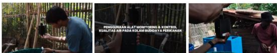
Gambar 5. Proses instalasi alat di kolam BUMDes oleh tim dan Karang Taruna

Satu unit alat dipasang di area usaha perikanan BUMDes yang mengcover 2 unit kolam berukuran diameter 1 meter, tinggi 1 meter (Gambar 5). Hingga saat ini, sudah tiga bulan tim pelaksana melakukan pendampingan (September – November 2025), alat berfungsi optimal dalam mendeteksi kekeruhan. Data monitoring mingguan menunjukkan fungsi alat yang signifikan positif, ketika nilai ppm sumber air untuk kolam 300 \leq \text{ppm} \leq 600 \text{ ppm} , maka air akan dialirkan ke langsung ke kolam ikan. Namun saat ppm sumber air untuk kolam >600 \text{ ppm} , maka air akan dialirkan ke boks filter untuk dilakukan penyaringan kotoran dulu. Hasil monitoring dan pendamping tercatat bahwa kesesuaian prinsip kerja tersebut berjalan optimal dengan persentase keberhasilan > 99\% .