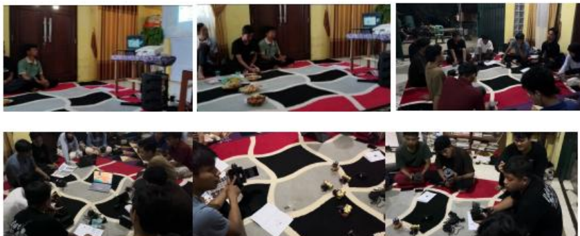
Gambar 3. Proses Pelatihan Perakitan dan Kalibrasi Alat oleh Anggota Karang Taruna

secara mandiri. Hasil ini membuktikan bahwa pemuda desa memiliki kapasitas yang cepat untuk mengadopsi teknologi sederhana ketika diberikan pelatihan yang terstruktur.