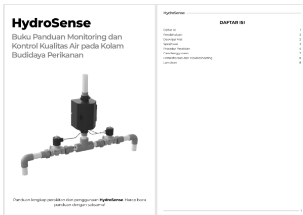
Gambar 7. Cover buku panduan operasional dan perawatan alat