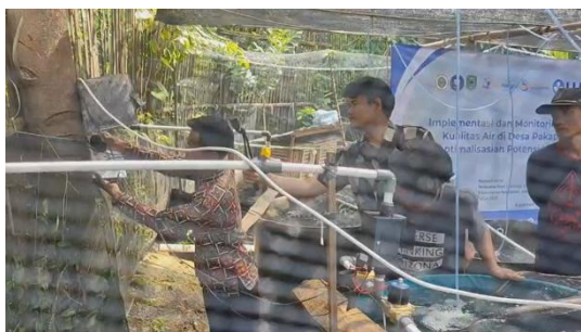
Gambar 6. Anggota Karang Taruna melakukan perawatan rutin pada alat yang terpasang

Program ini berhasil menciptakan model kolaborasi yang sinergis antara Karang Taruna dan BUMDes. Karang Taruna tidak hanya menjadi penerima manfaat pasif, tetapi bertransformasi menjadi technopreneur muda yang memiliki kompetensi teknis spesifik dalam mengoperasikan dan merawat teknologi akuakultur. Sementara BUMDes dapat fokus pada pengembangan usaha tanpa terbebani masalah teknis operasional. Pembentukan kelompok kerja (pokja) teknologi akuakultur dalam struktur Karang Taruna menjamin keberlanjutan program, dimana mereka kini memiliki peran strategis dalam pembangunan desa.