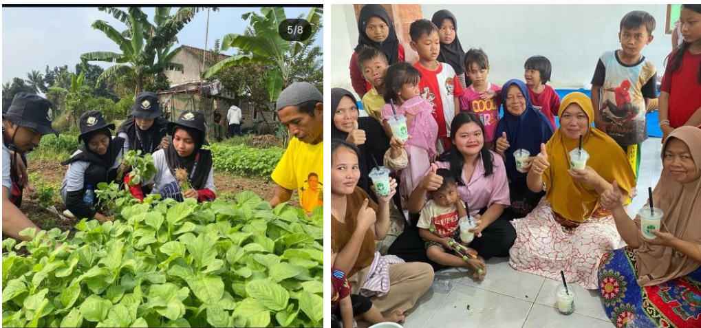
Gambar 2. Warga Desa Dukuh menikmati minuman inovasi BOBAYUR yang bahan bakunya sayur bayam. Tanaman banyak banyak terdapat di desa itu.