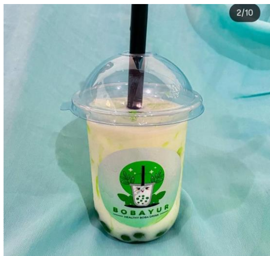
Gambar 1. Warga Desa Duku praktik membuat minuman inovasi BOBAYUR.